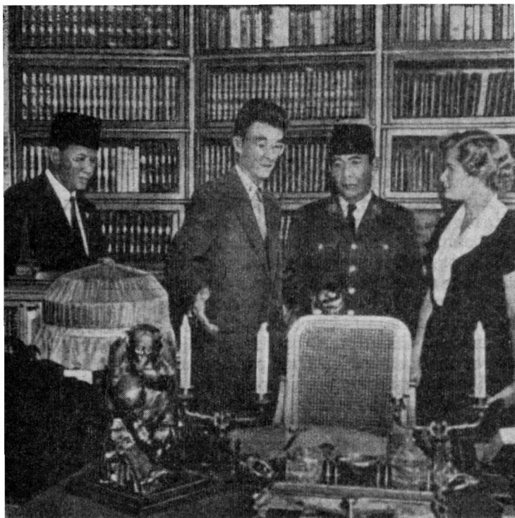
Почетный гость в музее-квартире В. И. Ленина в Кремле

смогут создать ничего, кроме ожесточения и разочарования» 32 , — заявил Сукарно.