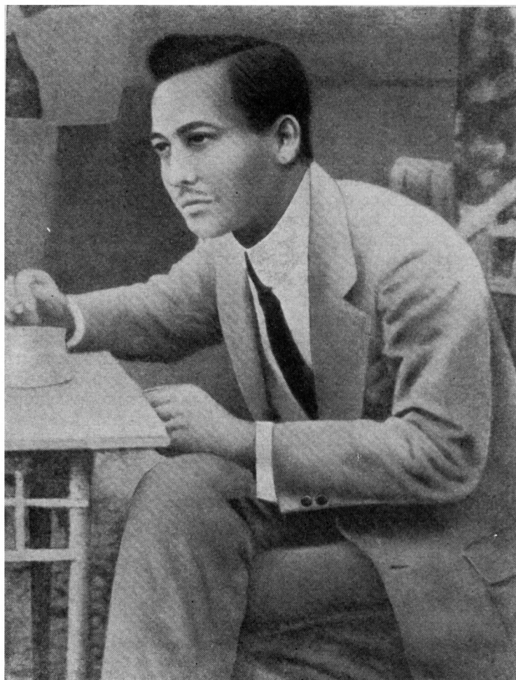
Сукарно — студент Технологического института в Бандунге

службы. Он принимал активное участие в работе «Буди Утомо». Это был на редкость прямой и смелый человек. Ни награда от правительства за проявленную им отвагу в борьбе с эпидемией чумы на Восточной Яве в 1911 году, которую он демонстративно вернул в знак протеста против политики колониальных властей, ни обещания присвоить его отцу дворянский