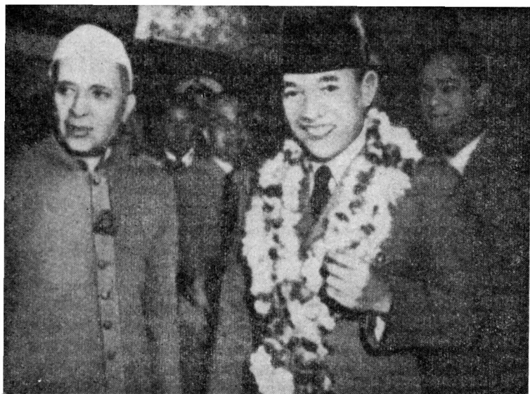
Сукарно и Неру

тельстве искусственно затягивали обмен посольствами.