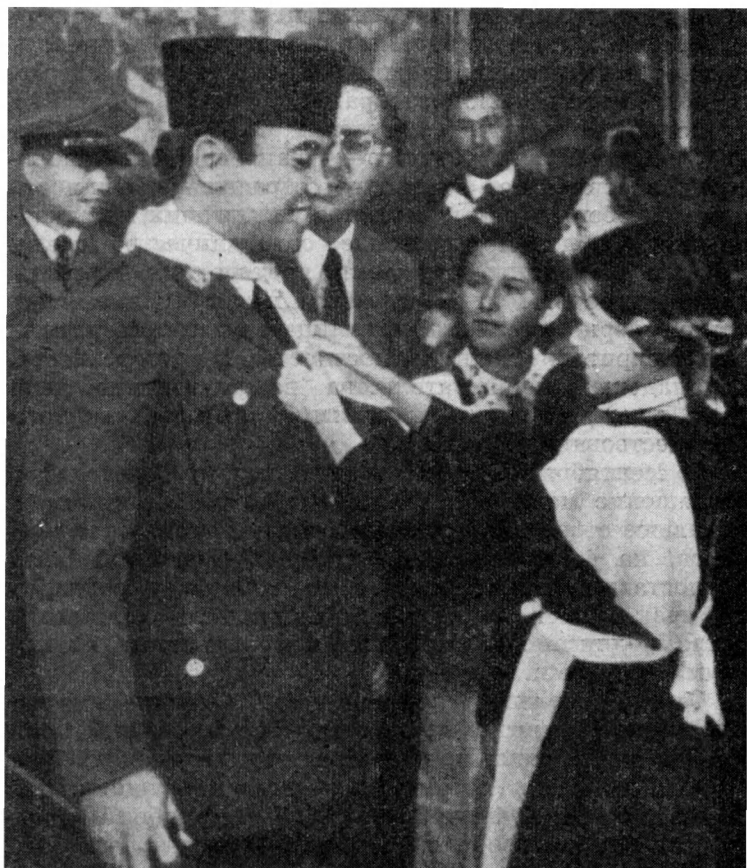
Во дворце пионеров города Свердловска

дороже всех товаров, которые может нам дать или продать любая страна» 33 .