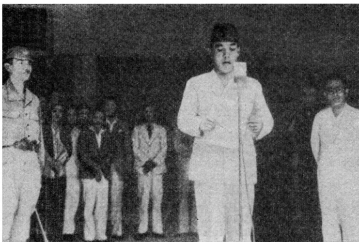
Сукарно оглашает текст Декларации независимости

работавший в конторе японской информационной службы «Домей», организовал передачу по радио сообщения об образовании независимого государства — Республики Индонезии. Провозглашение независимости означало конец господства не только японских захватчиков, но и голландских колонизаторов.