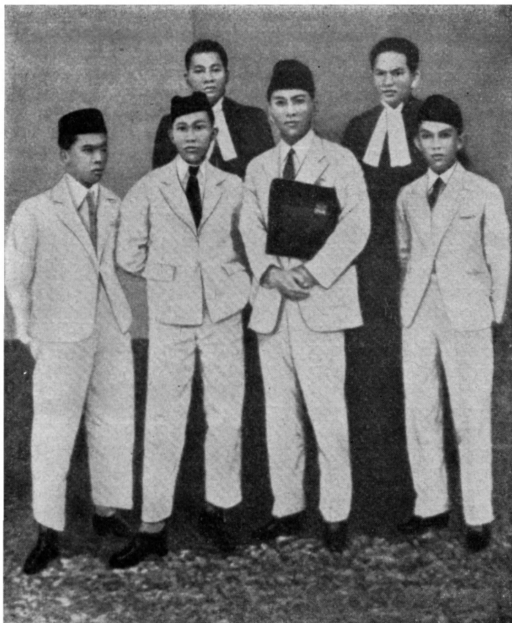
Сукарно и его соратники перед зданием суда в Бандунге

дия» 29 . Сукарно подчеркивал, что вопрос о том, быть или не быть революции, зависит от империалистов, а не от НПИ, которая стремится лишь оказать «моральное давление», чтобы заставить Голландию предоставить колонии независимость.