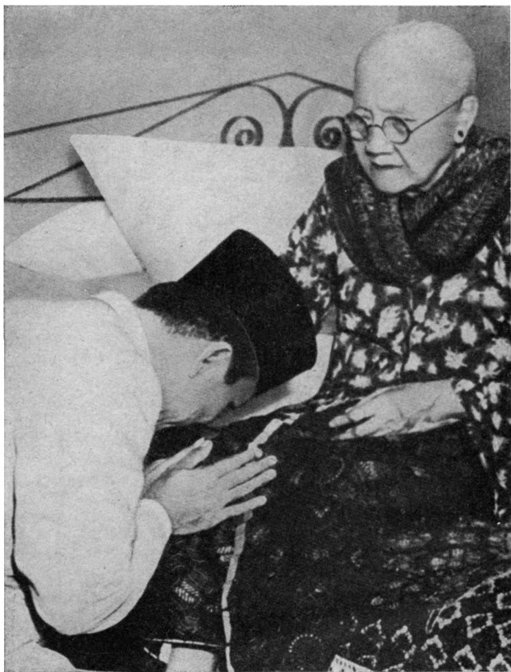
Сукарно с матерью

молодежи, город зарождавшейся национальной буржуазии. Здесь Сукарно впервые увидел современные оживленные улицы, трамвай, деловые кварталы, иностранные корабли.