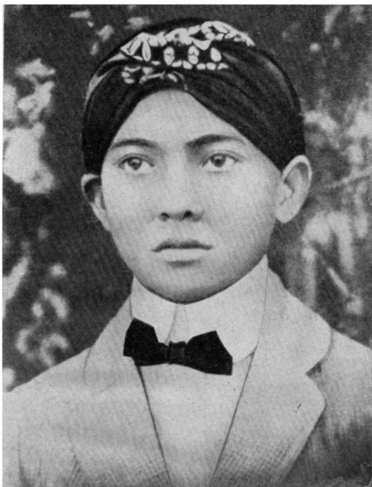
Сукарно — ученик голландской школы в Сурабае

ды перешагнула через него, а когда он встал, повернула его лицом к востоку и торжественно произнесла: «Никогда не забывай, что ты сын зари» 3 .