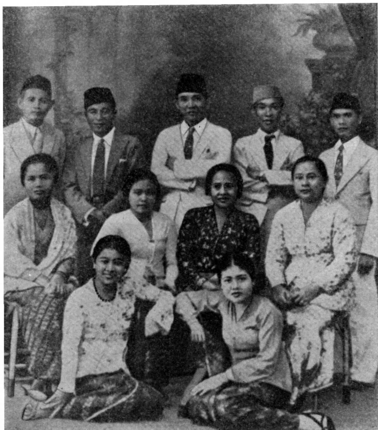
Сукарно во время ссылки в Бенгкулене

проводил с ней свободное время, гулял по вечерам, играл в бадминтон, обсуждал проблемы ислама и мусульманского брака.